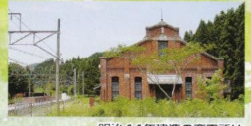
明治44年建造の変電所は国の重要文化財です