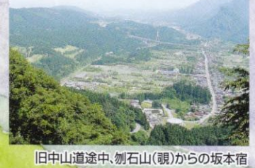
旧中山道途中、勿石山(観)からの坂本宿