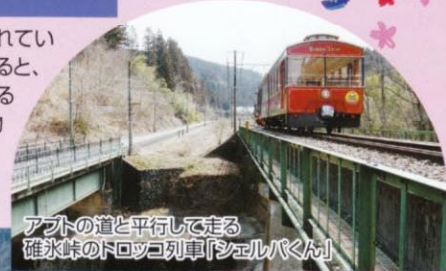
アプトの道と平行して走る碓氷峠のトロッコ列車「シェルバくん」

鉄道の歴史と列車が一同に集められているテーマパーク。入口のゲートを入ると、小さな子供から大人まで楽しめるSL「あぶとくん」が人気の的。本物の機関車を運転体験できるコースやズラリ展示された歴史的名車には、見て、触れることもできます。