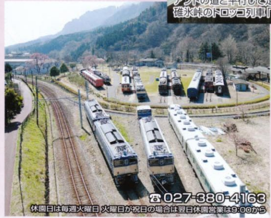
027-380-4163 休日は毎週火曜日 火曜日が祝日の場合は翌日休館営業は9:00から

文化むらから途中まではアプトの道の横を峠のトロッコ列車が走っています。トロッコ列車の運行は、基本的に(土・日と休日)ですが、臨時運行もあります。詳細はお問い合わせください。