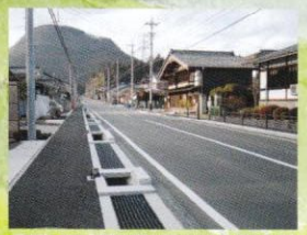
歩道・用水路が整備された坂本宿