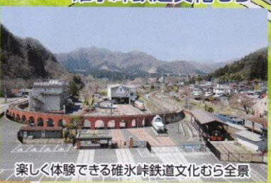
楽しく体験できる碓氷峠鉄道文化むら全景

碓氷峠路探訪 遊歩道アプトの道へは、ウォーキングシューズを履いて念のため害虫除けをしてからお出かけください。