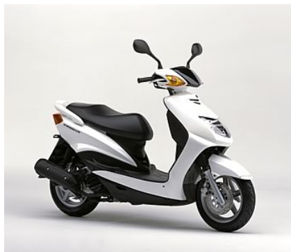
ヤマハスクーター「CYGNUS X」(シグナスX)

なお、本製品の製造はヤマハモーター台湾(株)で行ないます。また今春の「大阪モーターサイクルショー」(3月21日～23日・インテックス大阪)と「東京モーターサイクルショー」(4月4日～6日・東京ビッグサイト)にて展示されます。