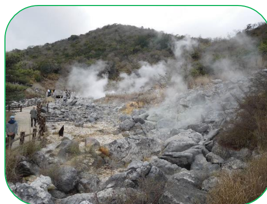
宿は 雲仙温泉 (地獄谷)