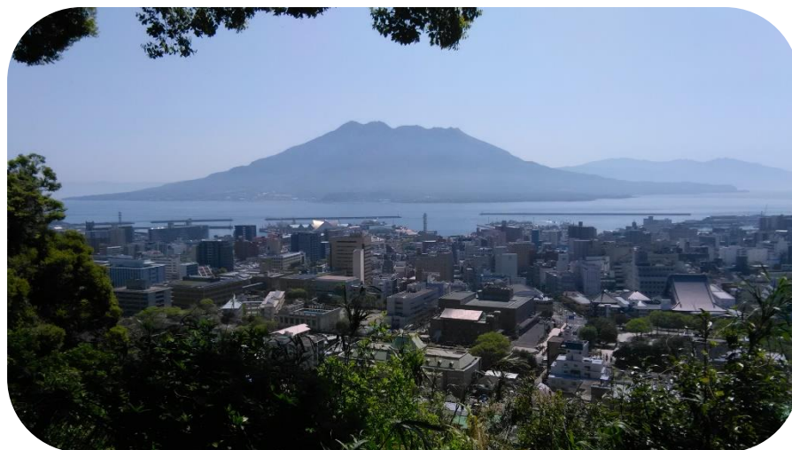
城山展望台から桜島を臨む 好天