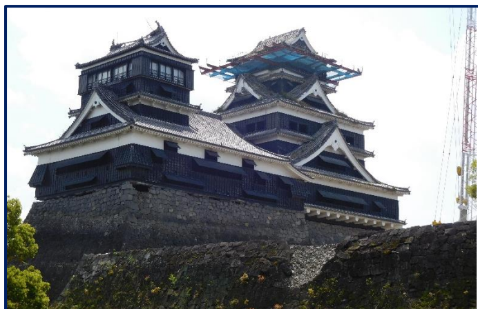
熊本城天守閣も修理工事中