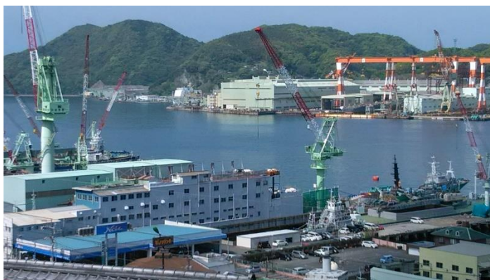
グラバー邸からの長崎港