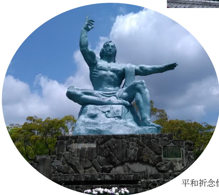
平和祈念像と折鶴の塔