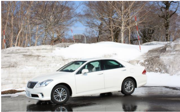
途中はまだこんな雪景色