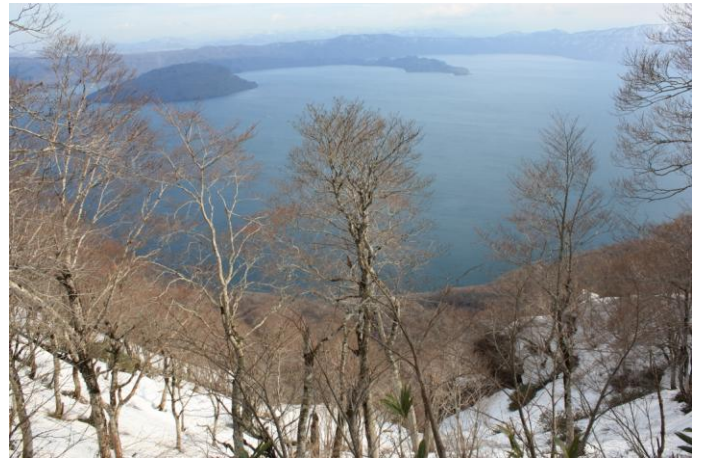
峠から見た十和田湖