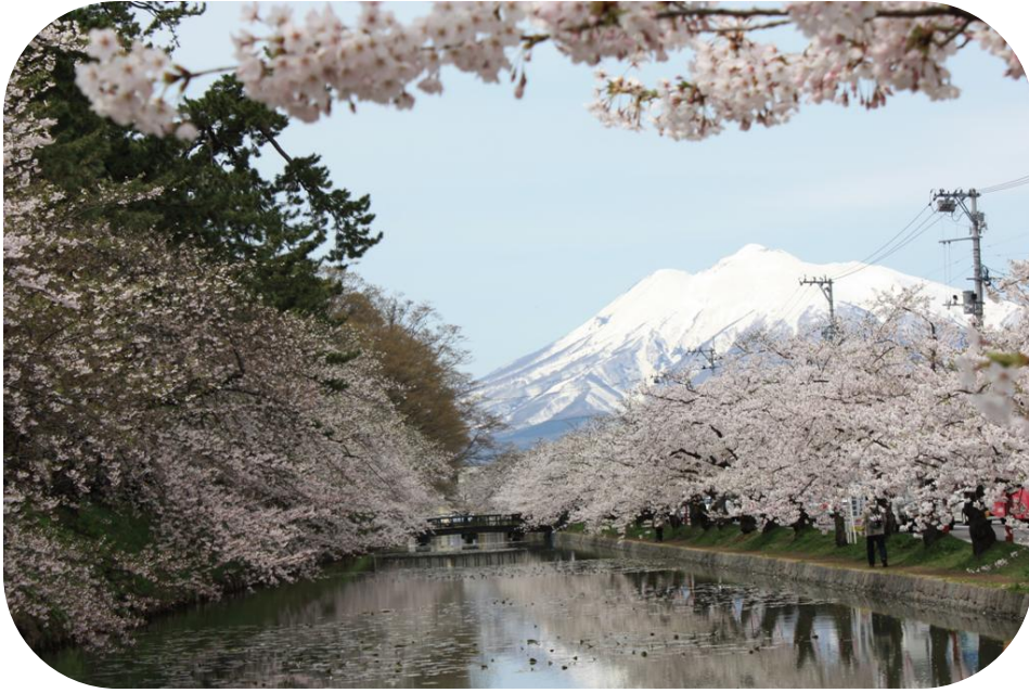
2日目は快晴 お岩木山もくっきり