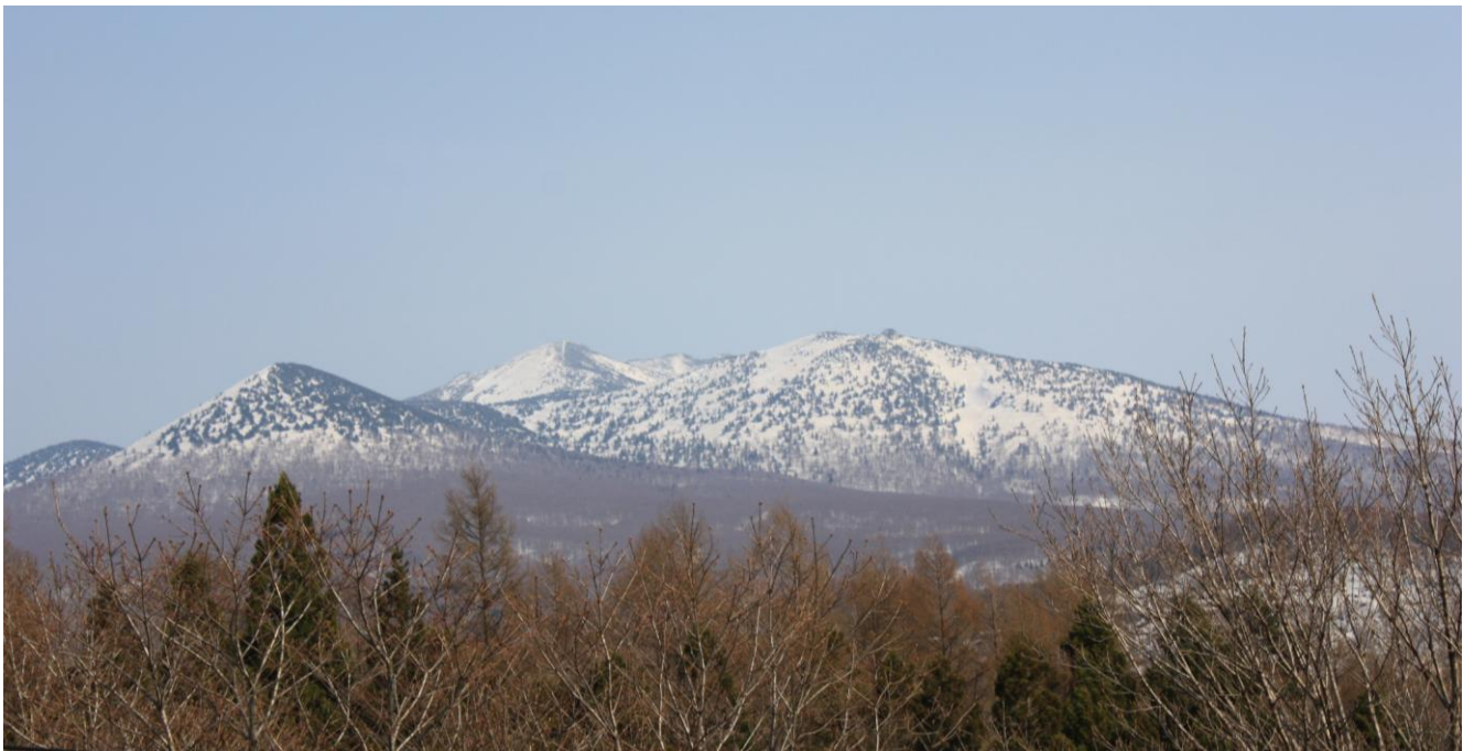
最後は八甲田山も