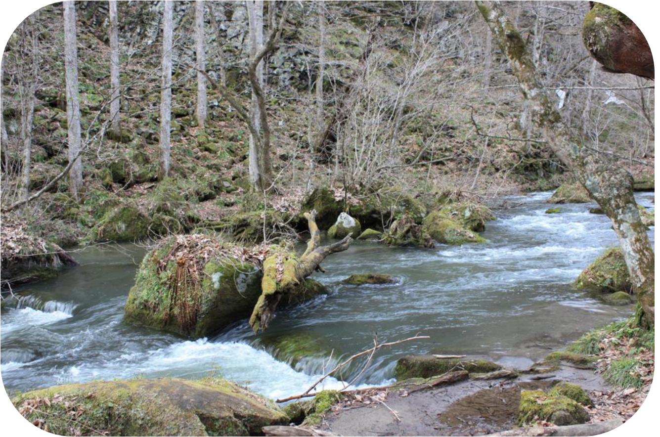
春を待つ奥入瀬溪流