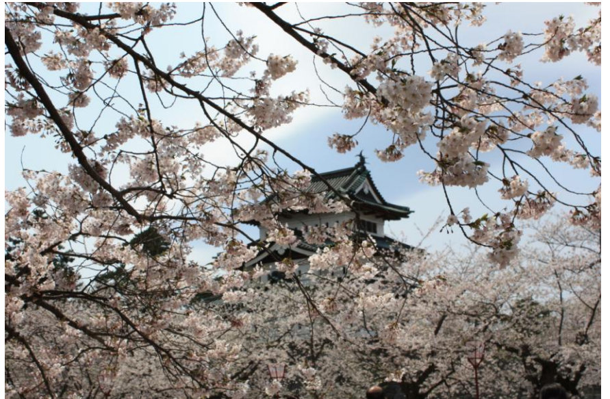
これぞ弘前城の桜