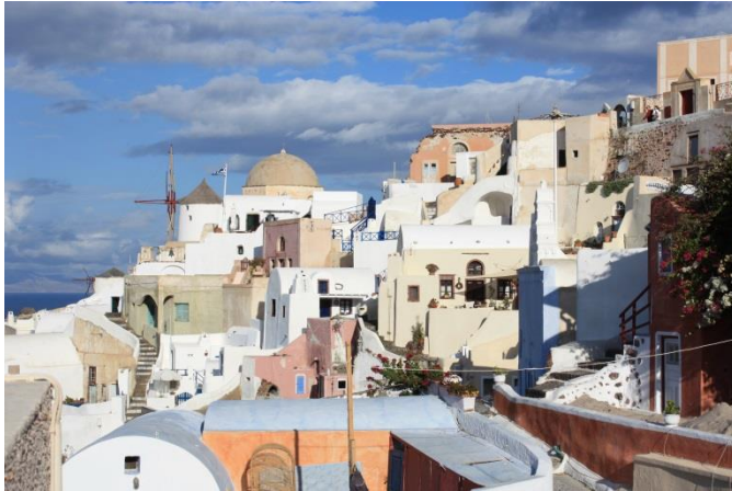
イアの街、白が映える