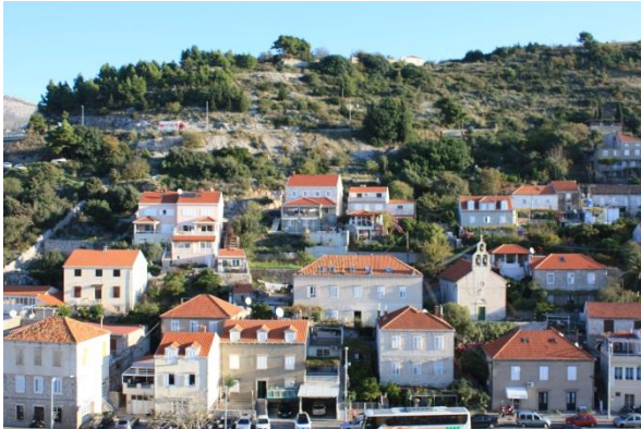
アドリア海の宝石