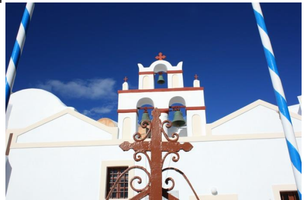
フィラの街の教会