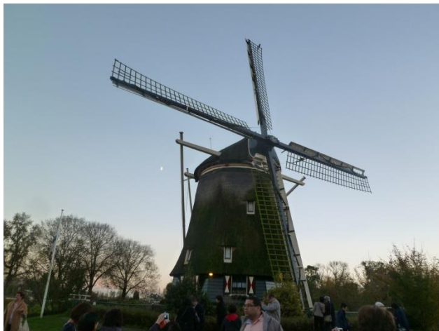
アムステルダムの風車