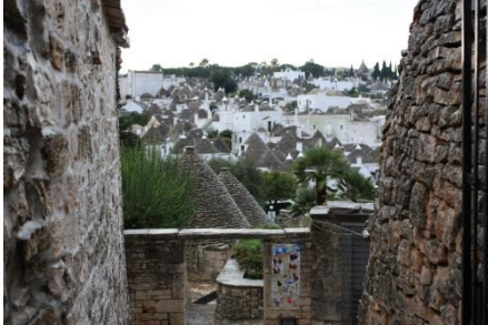
アルベロベッコの建物