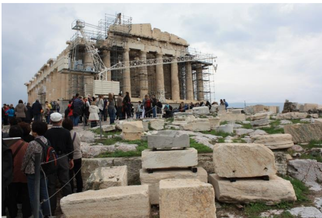
アクロポリスの丘