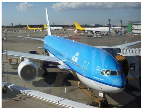
再びアムステルダムから成田へ