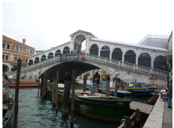
ベネチア・リハルト橋再び