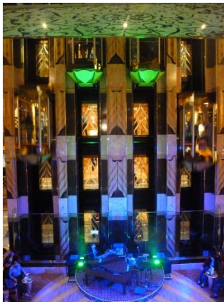
内部エレベーター